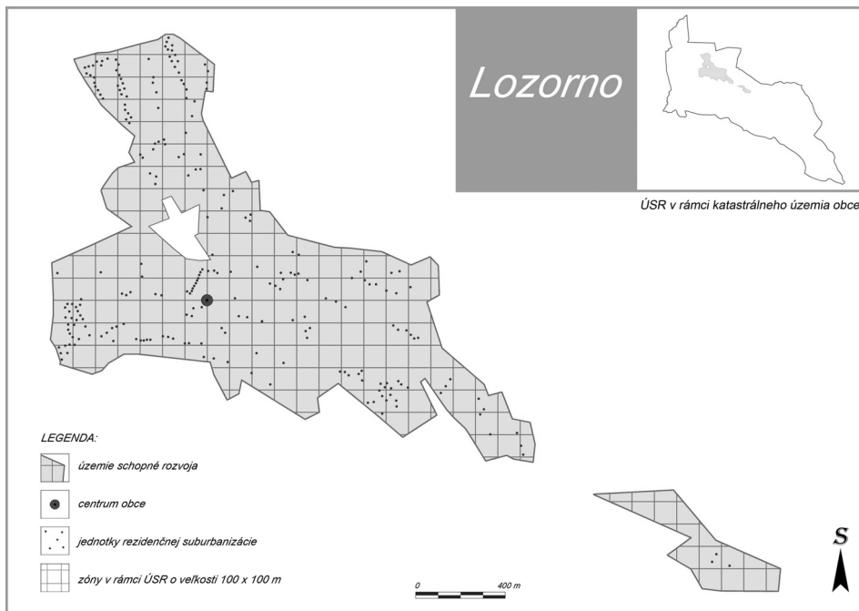
Obrázok 1 Rozmiestnenie jednotiek rezidenčnej suburbanizácie v ÚSR obce Lozorno

Z výsledkov môžeme pozorovať, že nová suburbanná výstavba sa v sledovaných obciach líši nielen rozsahom, ale aj spôsobom usporiadania v priestore. Pri porovnaní s dvoma ďalšími skúmanými obcami vykazuje Lozorno oveľa nižšiu hustotu novej zástavby, vysokú napojenosť ( kontinuitu ) na pôvodnú obec a relatívne rovnomerne rozmiestnené objekty novej zástavby v širšom centre obce (obr. 1). Nová rezidenčná výstavba využíva miesta na okraji pôvodnej obce a nezastavané parcely v rámci existujúcej zástavby. S výnimkou dvoch lokalít v severnej a západnej časti obce prebieha výstavba formou individuálnych projektov. Nová výstavba nenarušuje kompaktnosť obce, keďže dochádza jednak k prirodzenému rozširovaniu obce, ako aj k vyplňovaniu voľných parciel. Táto situácia vyplýva aj z platného územného plánu obce, ktorý zatiaľ nevyčlenil rozsiahlejšie parcely, ktoré by boli atraktívne pre investorov s rozsiahlejšími obytnými projektmi. Treba však poznamenať, že absencia veľkých stavebných projektov súvisí s obmedzenou kapacitou existujúceho vodárenského systému obce. Situácia sa môže zmeniť po vybudovaní nového zdroja pitnej vody, ktorý bude pravdepodobne znamenať štart pre ďalší rozvoj obce (Mančíková, 2007). Kým sa však nevyrieši nedostatok vody, rozvoj obce bude obmedzený.